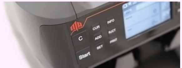
デュアルユーザー対応 操作パネル