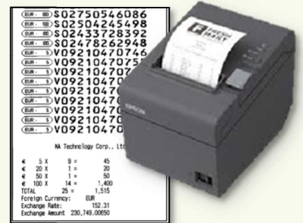
レシートサンプル