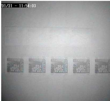
赤外光 印紙(上真正券、下偽造券)