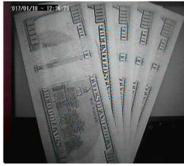
赤外光 スーパーノート(左から2枚目偽造券)