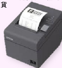
高速グラフィック サーマルプリンター