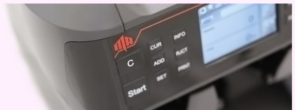
デュアルユーザー対応 操作パネル