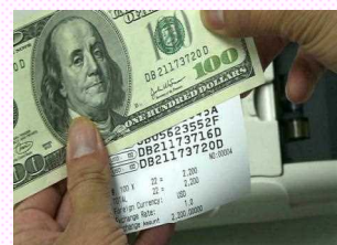
ジャーナル紙への印字

DB21173720D ←写真 DB21173720D ←FAX DB21173720D ←デジタル