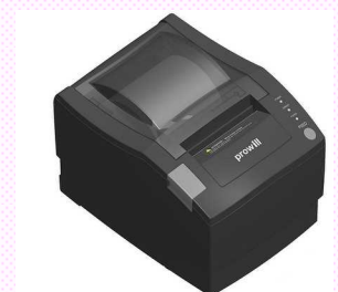
高速グラフィックサーマルプリンター