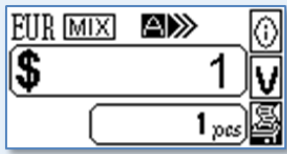
MIX・自動start・高速モード